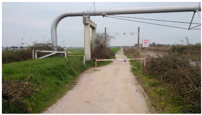
foto 3 sbarra esistente