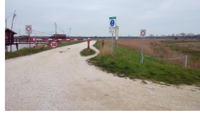
foto 5 sbarra esistente