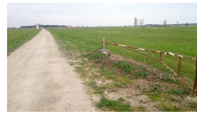
foto 4 sbarra esistente