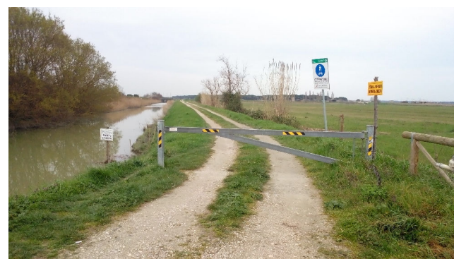
foto 2 sbarra esistente